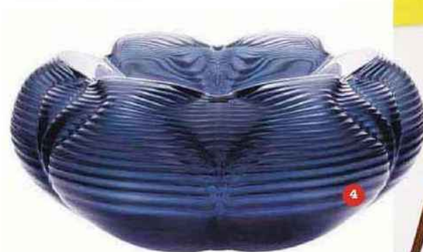
4. Coupe FONTANA , couleur bleu nuit, collection Crystal Architecture by Zaha Hadid.