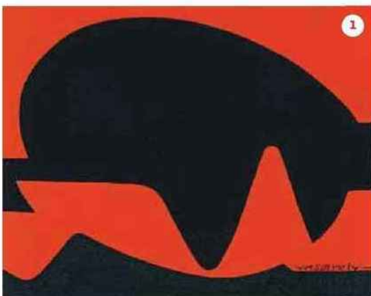
1. Composition en rouge et noir , circa 1950, de Victor Vasarely.