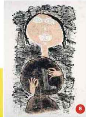
5. Raccommodeuse de chaussettes (W21) Matière et Mémoire , 1944, de Jean Dubuffet.