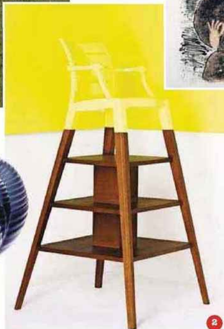
2. Aile Family chaise bibliothèque bicolore , (Industrial Orchestra).