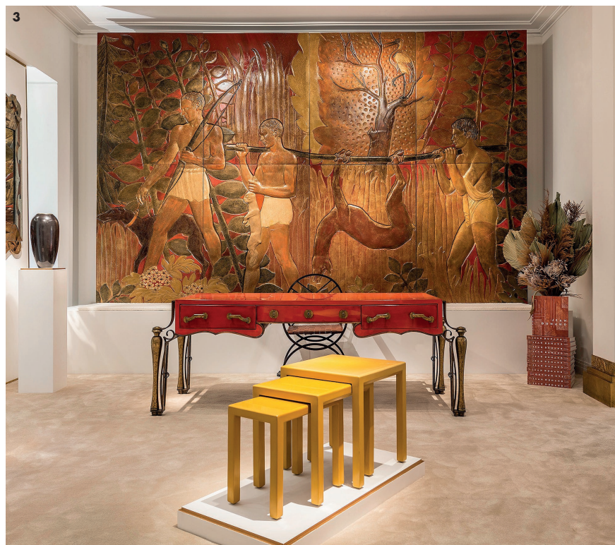
1. Vase ovoïde, vers 1925. 2. Bar aux poissons japonais, 1928, et miroir de Jacques-Émile Ruhlmann. 3. Bureau plat d'Eugène Printz et Jean Dunand, tables gigognes laquées jaune, panneau Le Retour des chasseurs , 1935, provenant du Normandie. (En haut, Jean Dunand lors du voyage inaugural).

Quant à son fils Félix-Félix, il dirige à présent la galerie de la rue Bonaparte. Bien évidemment, pour célébrer dignement cette parution, il avait organisé une exposition consacrée à Jean Dunand, avec notamment un bar et un bureau, des tables basses incrustées de coquille d'œuf, de grands vases et un ensemble de huit panneaux en laque dorée provenant du Normandie. Quelques chefs-d'œuvre parmi les 1800 pièces référencées dans l'ouvrage, car Jean Dunand (1877-1942) a eu une carrière riche. Formé à la sculpture, il s'oriente vers la dinanderie, puis apprend les secrets de la laque auprès d'un maître japonais. Très vite, ses paravents deviennent célèbres, tout comme son style. Tout aussi doué pour le dessin, il portraiture les figures de l'époque: Jeanne Lanvin, Madeleine Vionnet, Joséphine Baker. Toujours à la frontière entre arts plastiques et arts appliqués, il fait merveille pour décorer des intérieurs de riches esthètes ou les transatlantiques qui ne sont alors pas moins luxueux. Ambassadeur de l'Art déco dans ce qu'il a de plus raffiné et de plus artistique, il ne pouvait que séduire Félix Marcilhac.